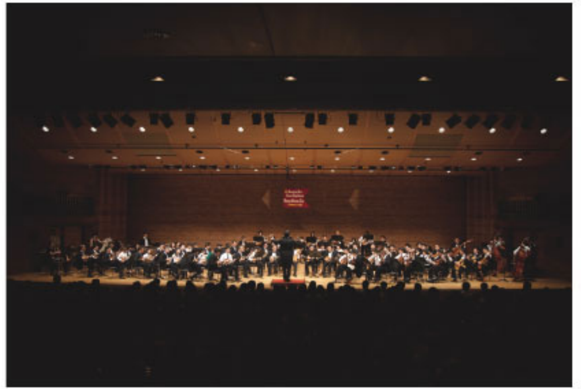
第7回みんなあつまれ演奏会