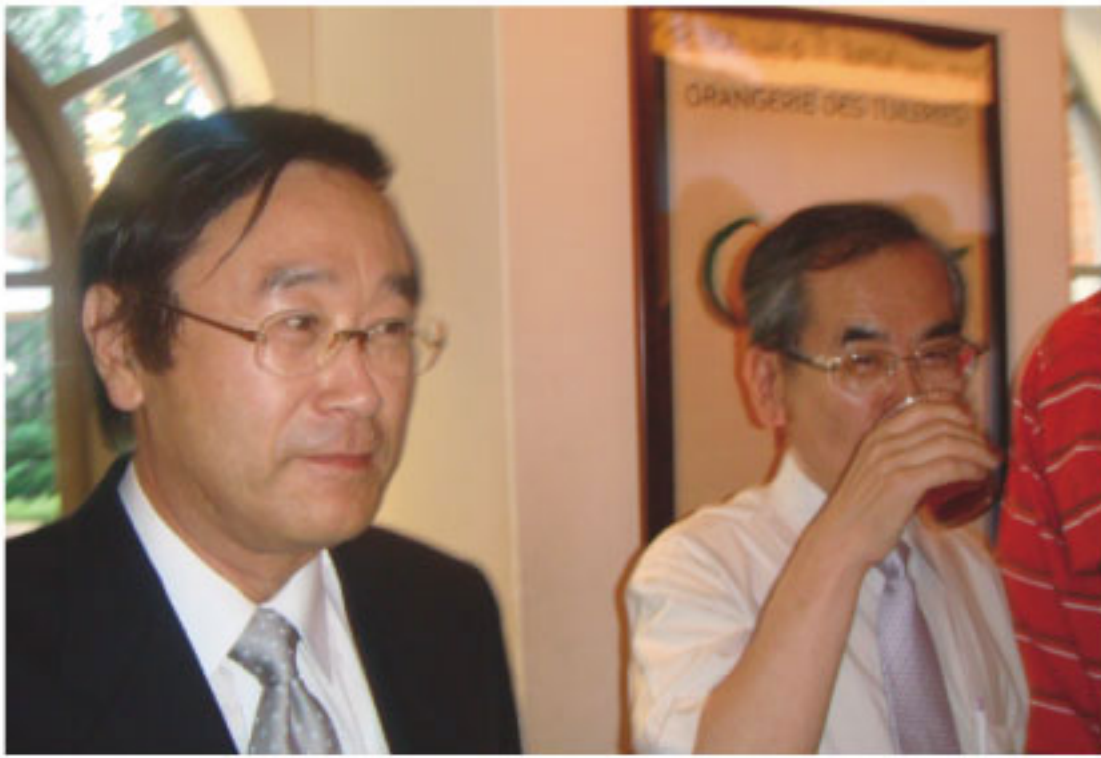
西山校長・市野顧問