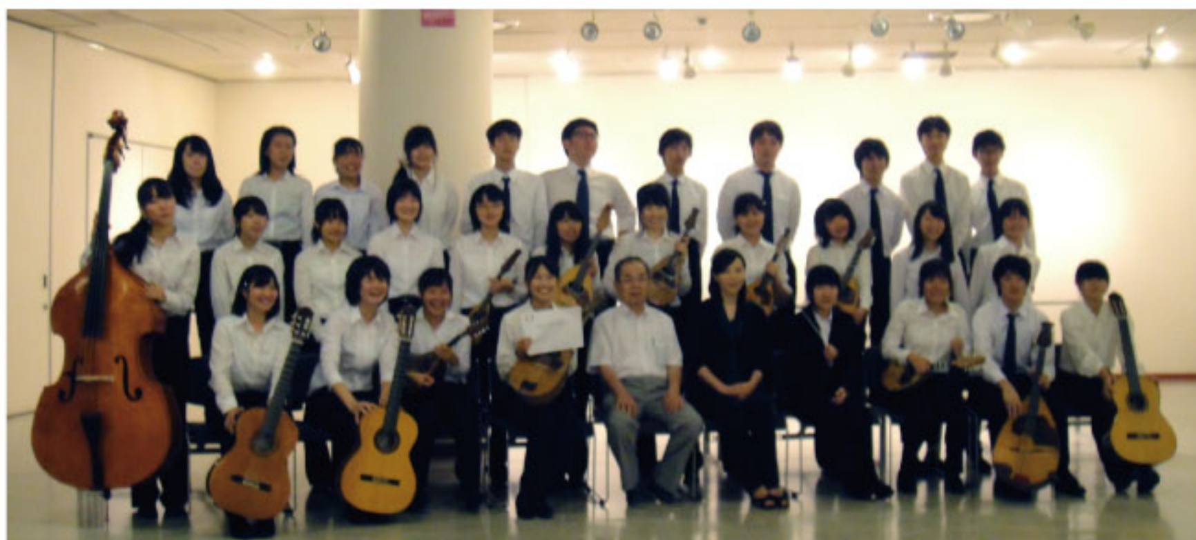
コンクール出場メンバー（顧問を囲んで集合写真）

今回の結果に満足せず、部員一同これからも練習に励んでいきたいと思っておりますので、ご指導よろしくお願いたします。